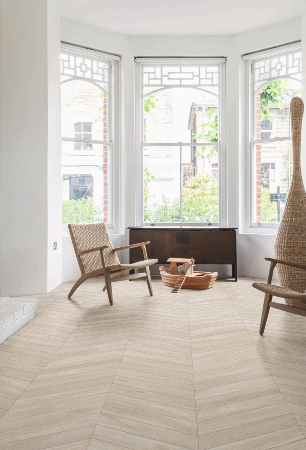
Woodchoice Chevron Milk 11 × 54