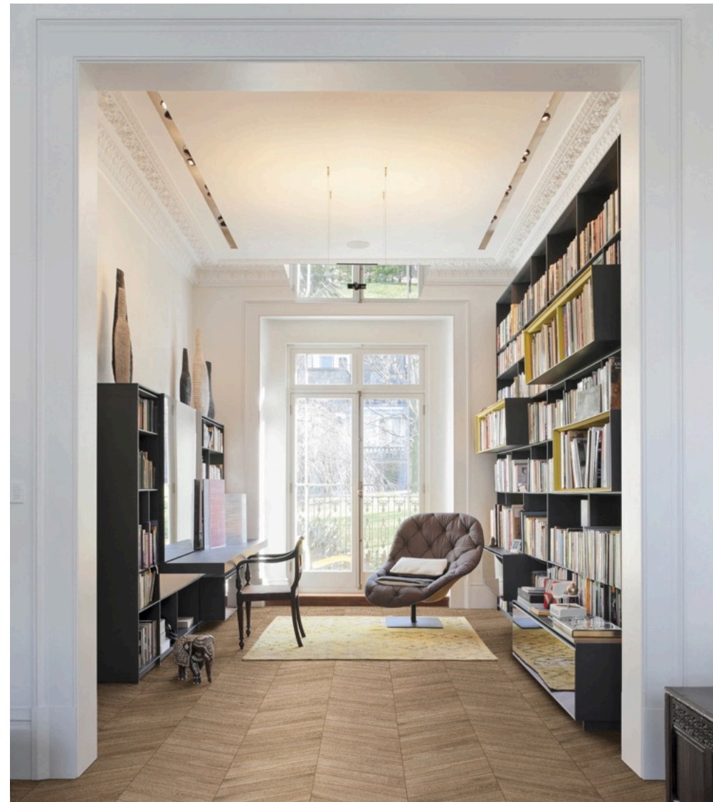
Woodchoice Chevron Coconut 11 × 54