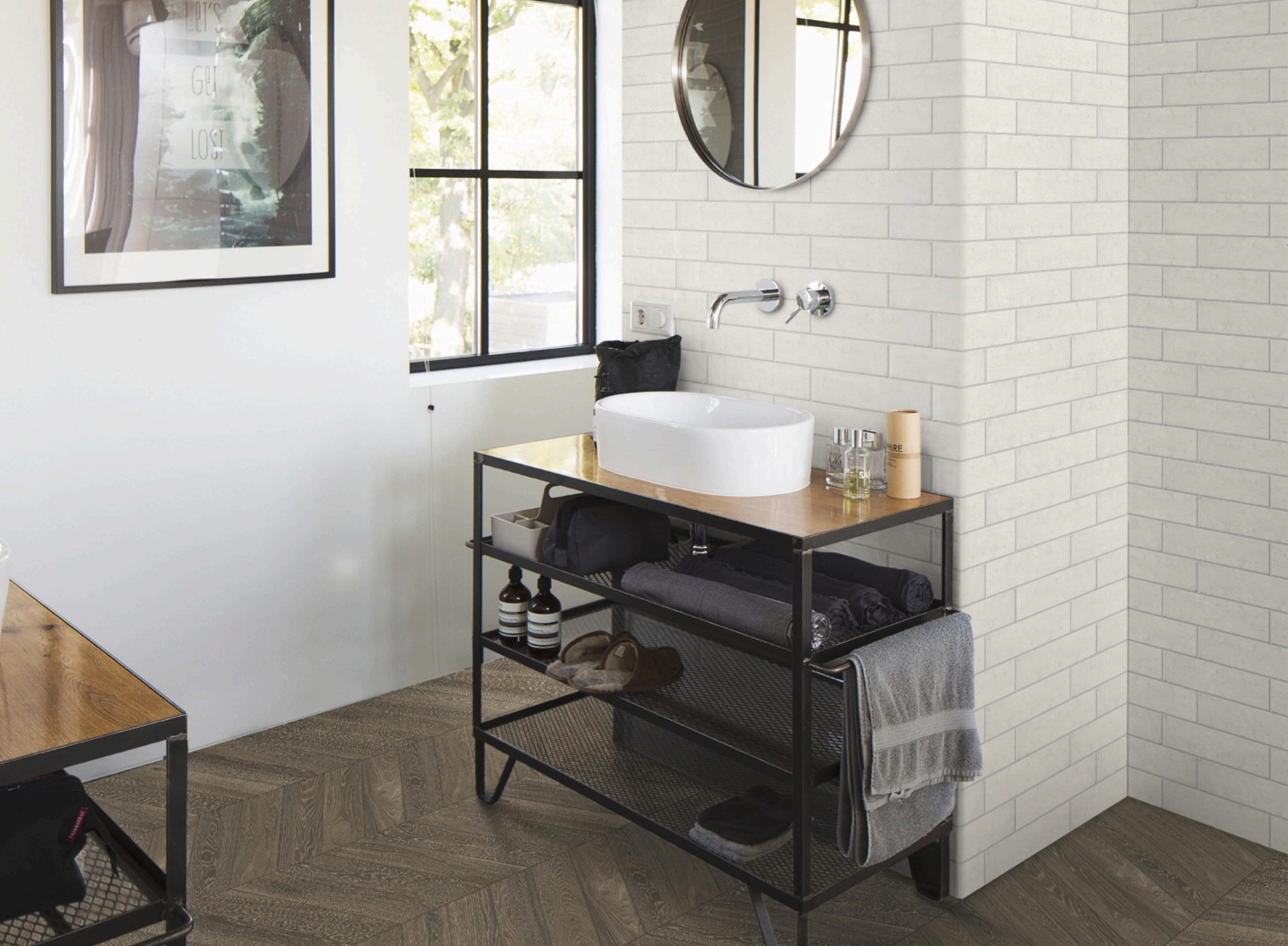
Woodchoice Chevron Tea 11 × 54