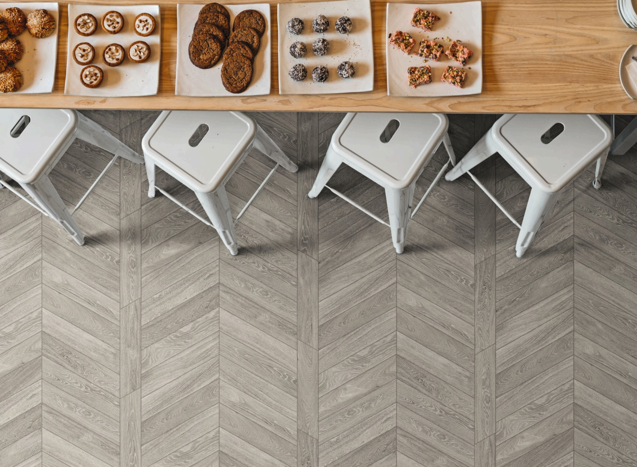
Woodchoice Chevron Salt 11 × 54