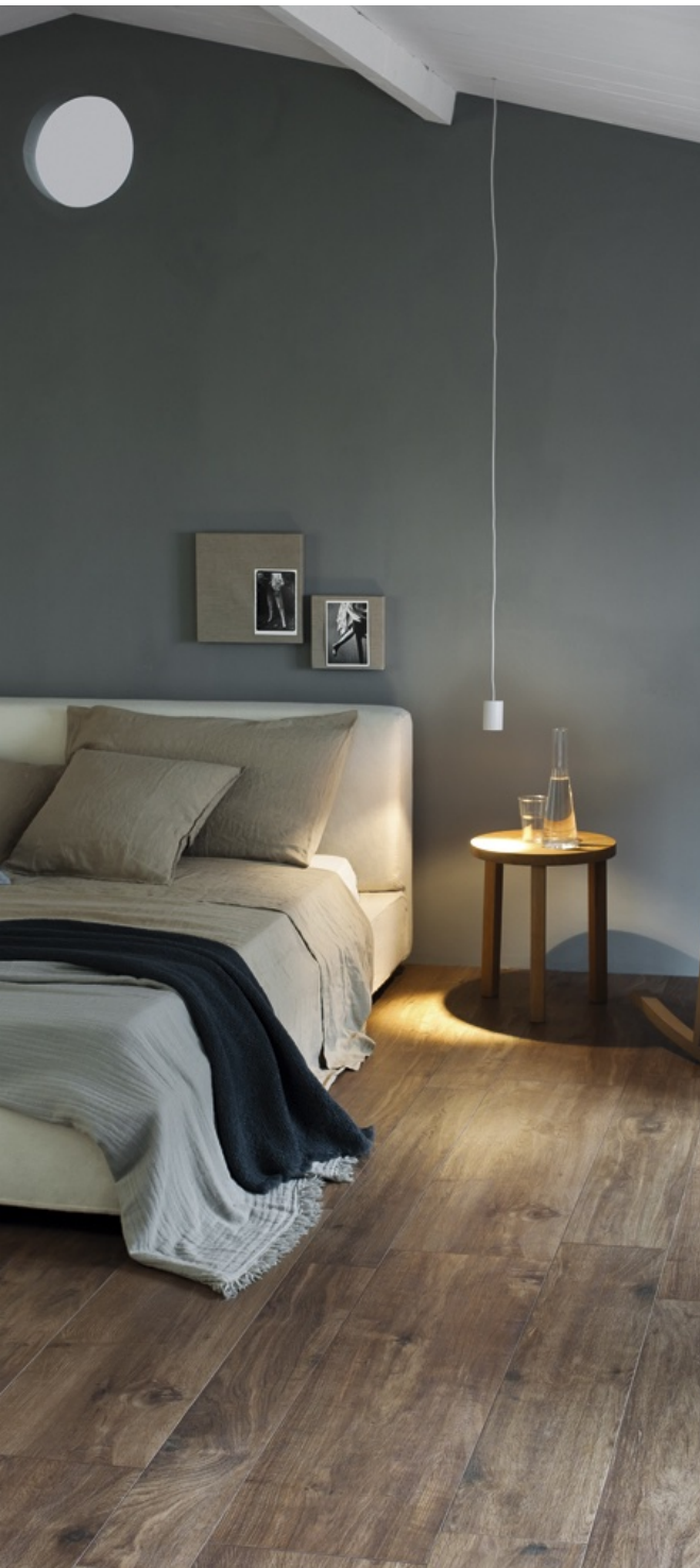
Treverk Home 20 Castagno 20 x 120