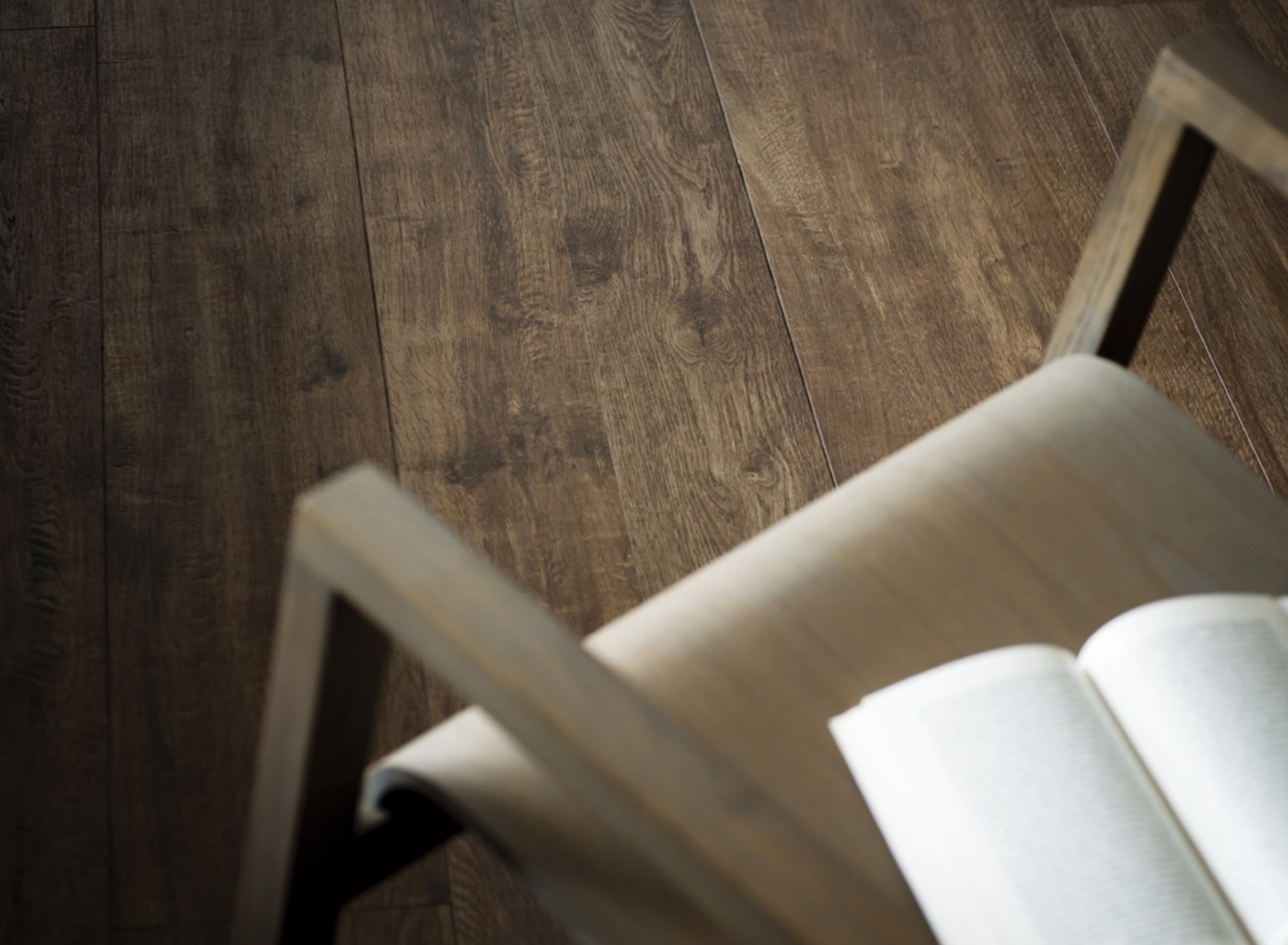
Treverker Home 20 Castagno 20 x 120