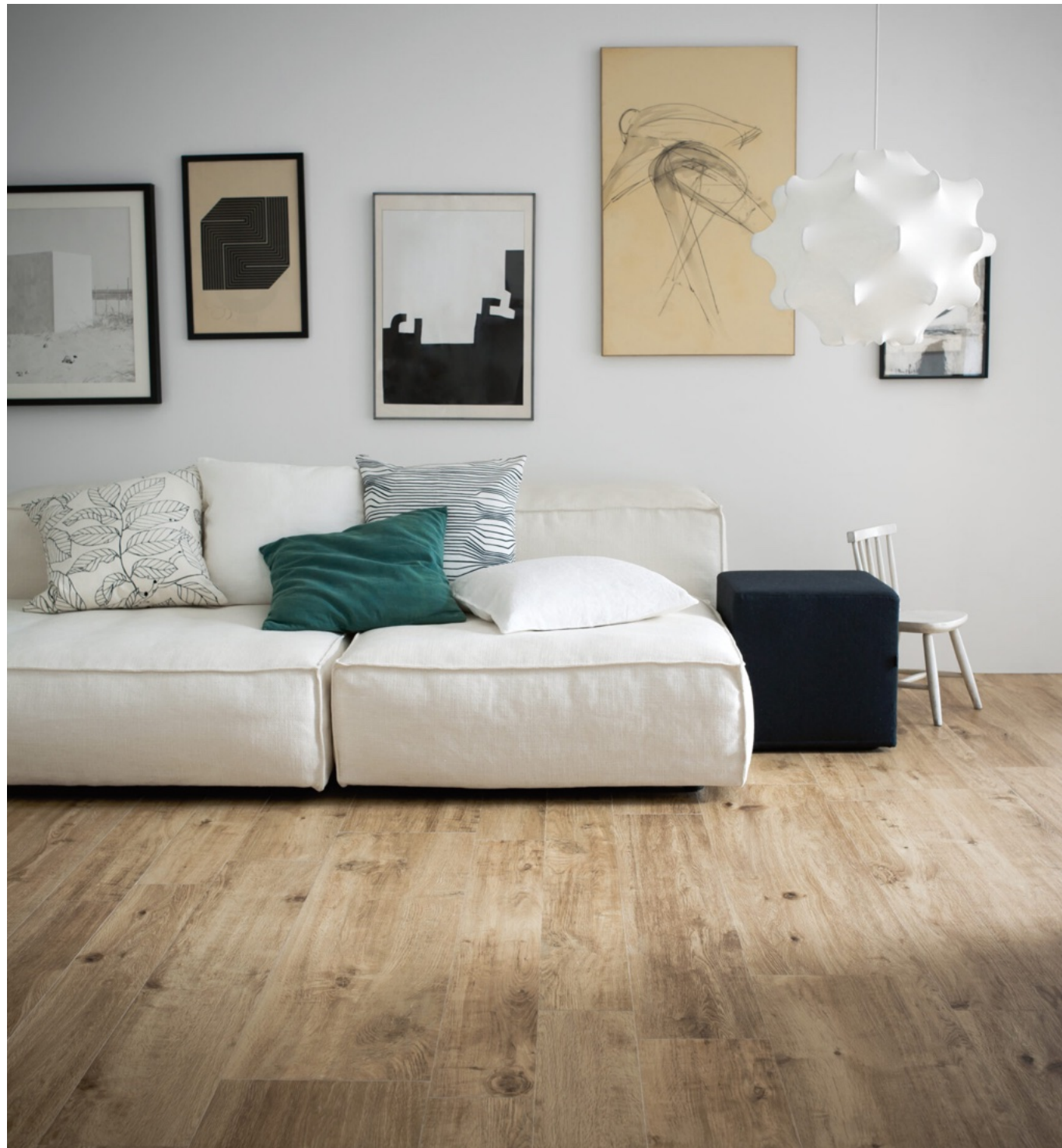
Treverk Home 20 Larice 20 x 120