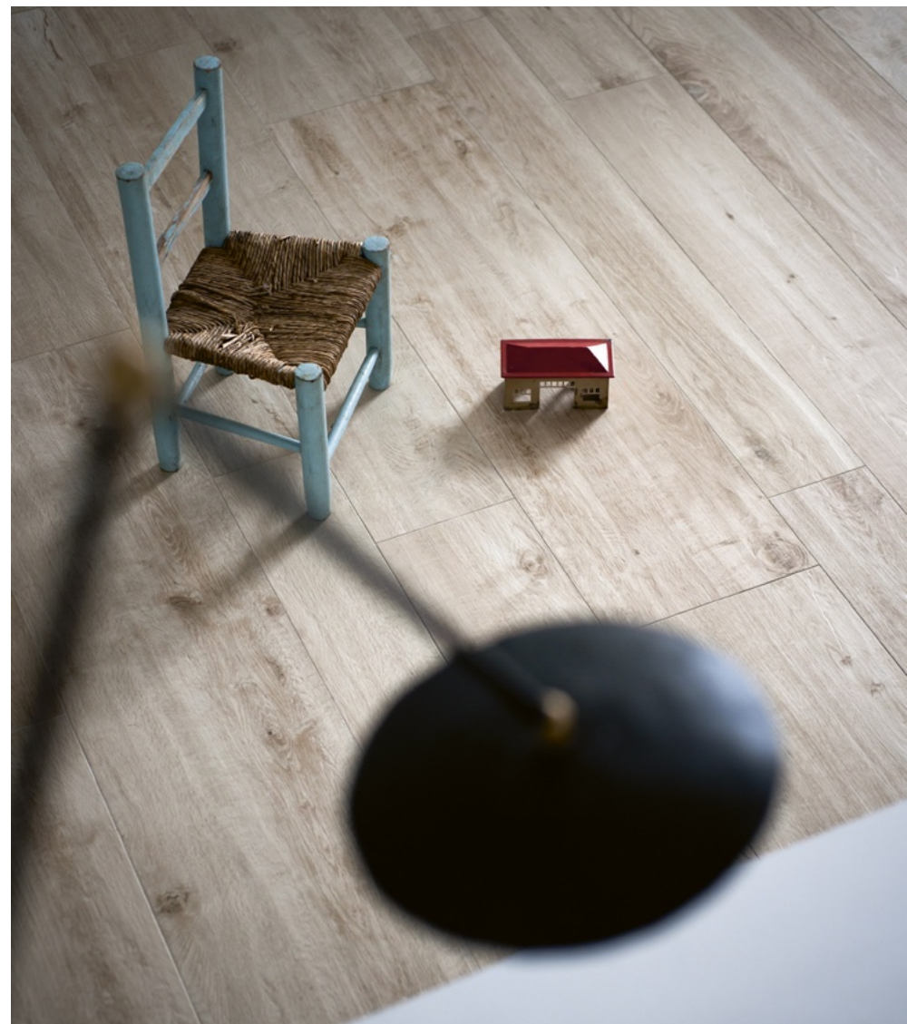
Treverk Home 20 Betulla 20 x 120