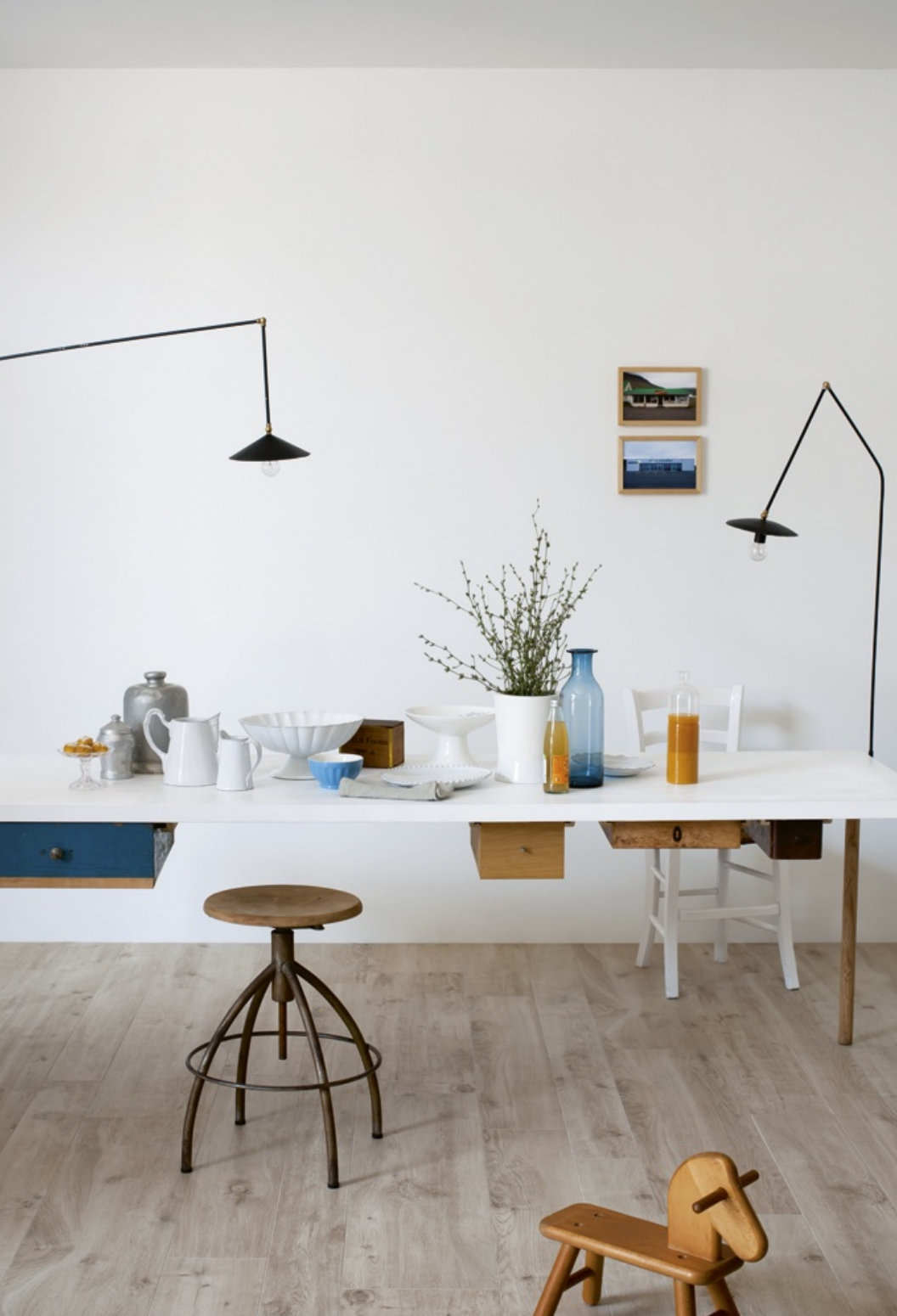
Treverk Home 20 Betulla 20 x 120