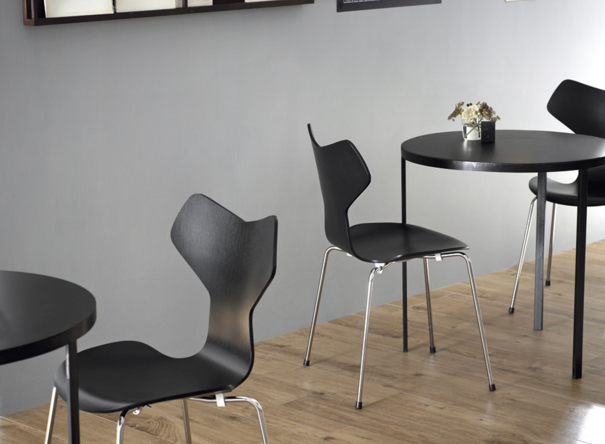
Treverk Home 20 Olmo 20 x 120