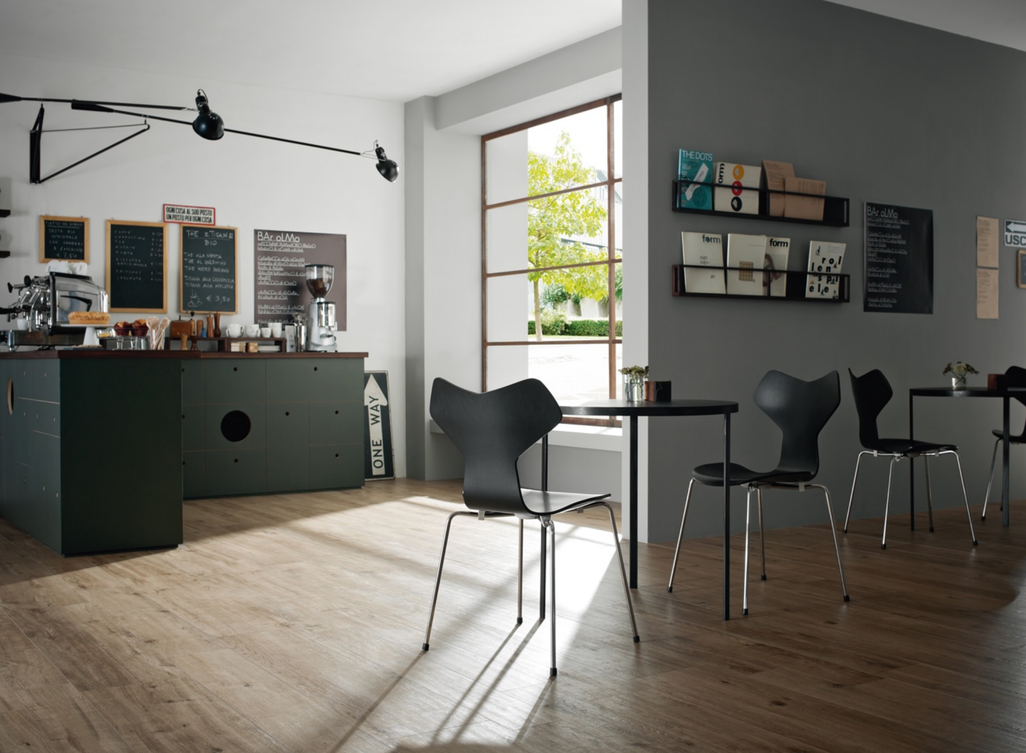
Treverk Home 20 Olmo 20 x 120