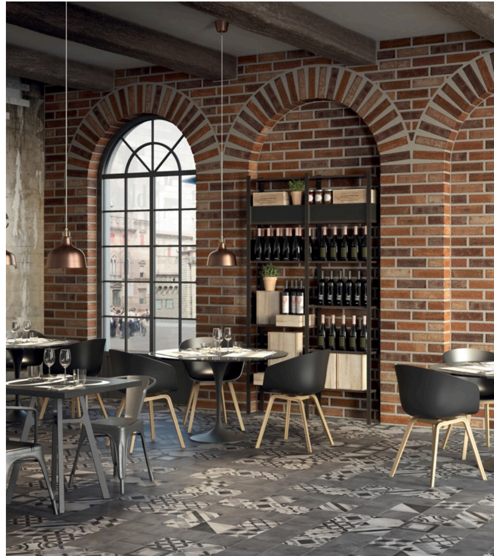
Terra 20 Decori Mix 20 × 20