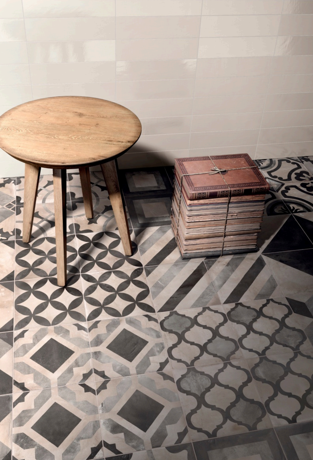
Terra 20 Decori Mix 20 × 20