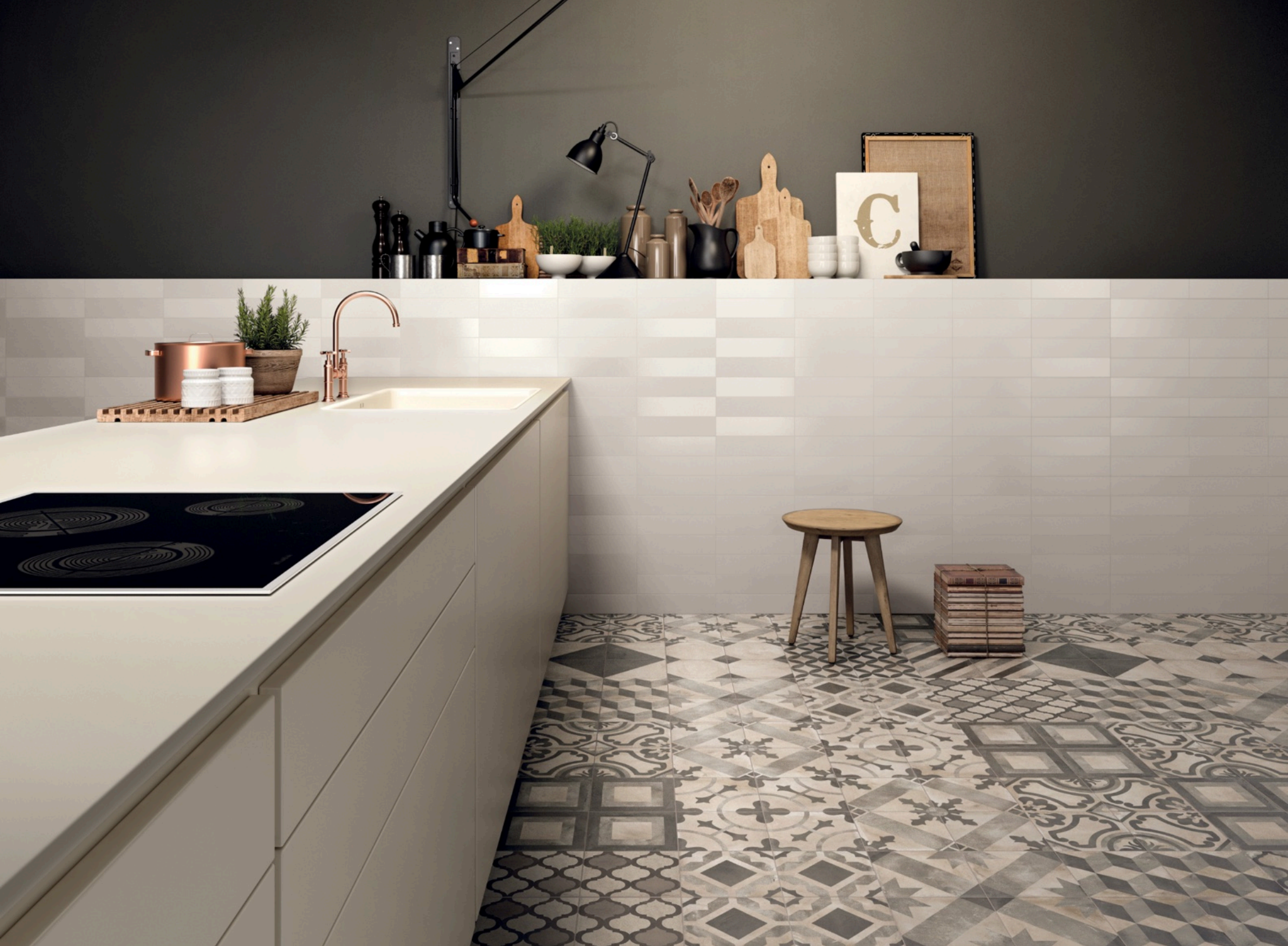
Terra 20 Decori Mix 20 × 20