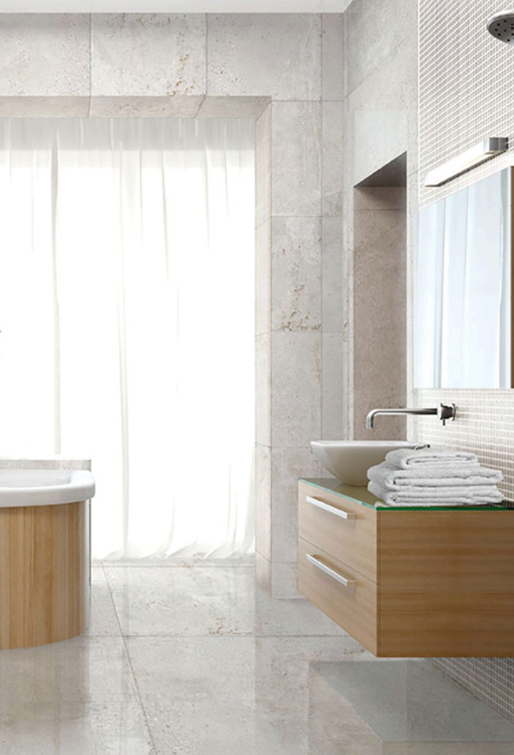
Stonecement White Glossy 120 × 120