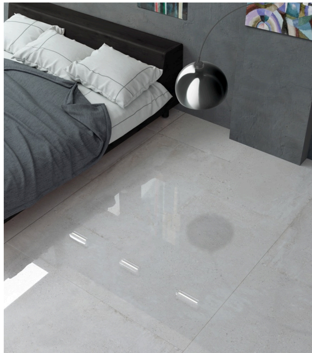
Stonecement White Glossy 120 × 120