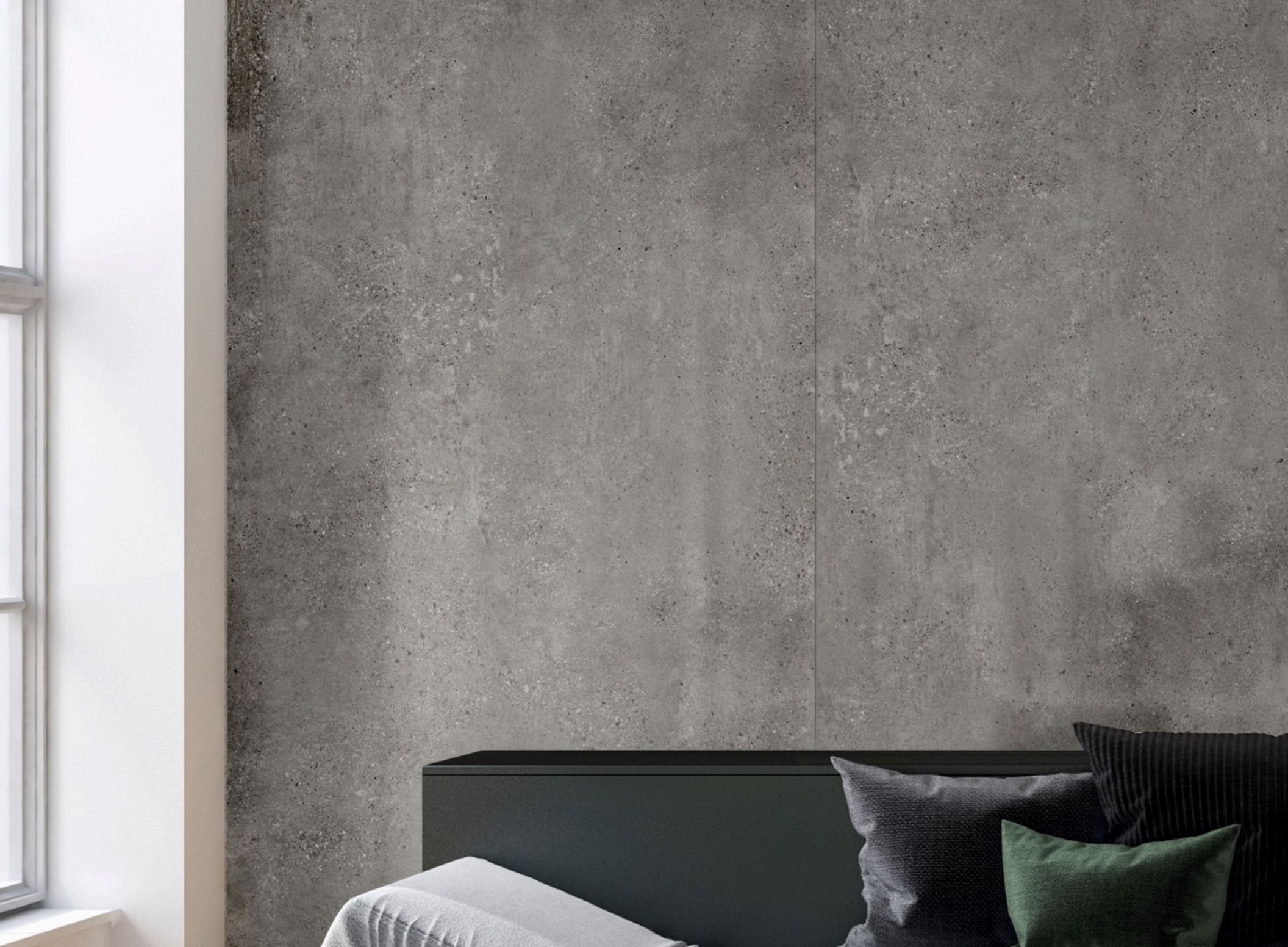
Stonecement Antracite Glossy 120 × 120