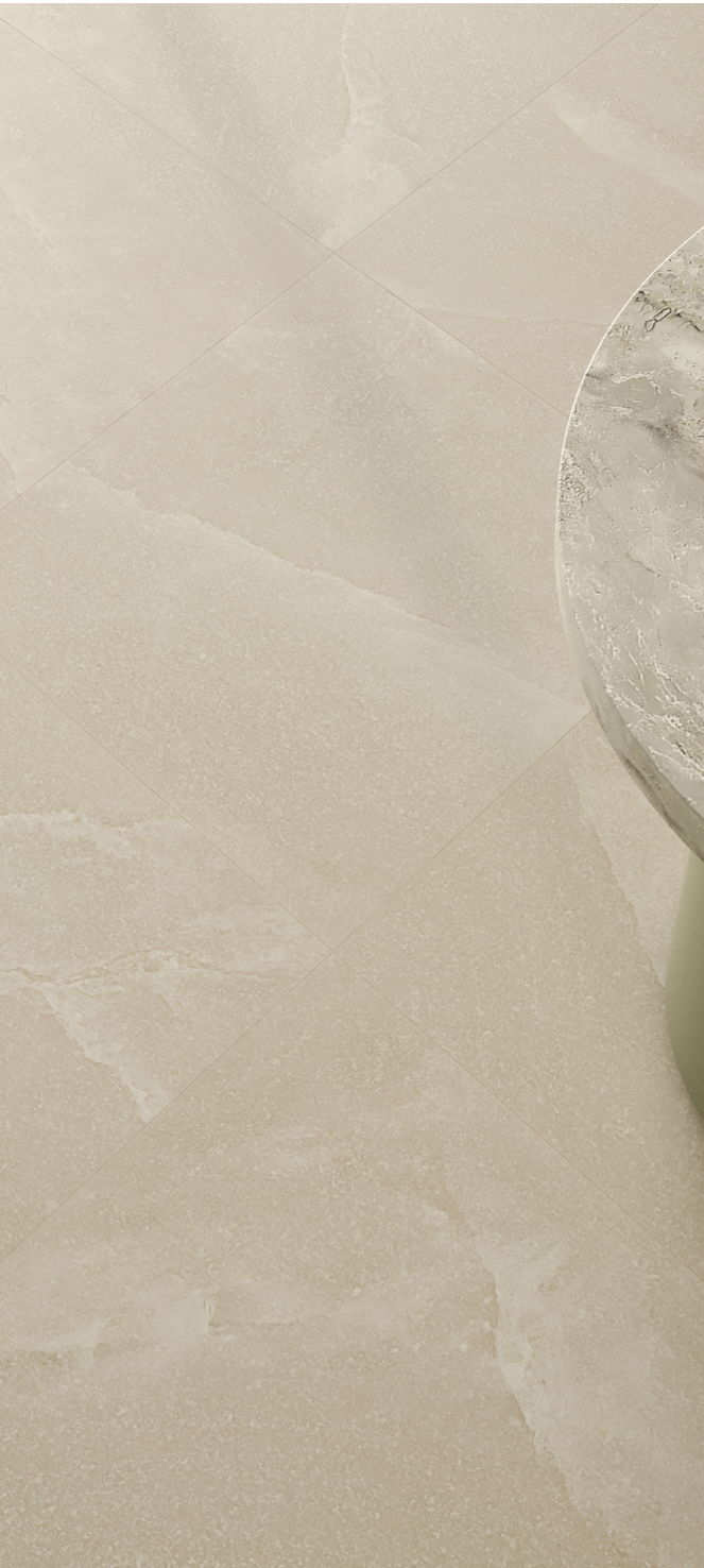
Salt Stone Sand Dust 90 × 180