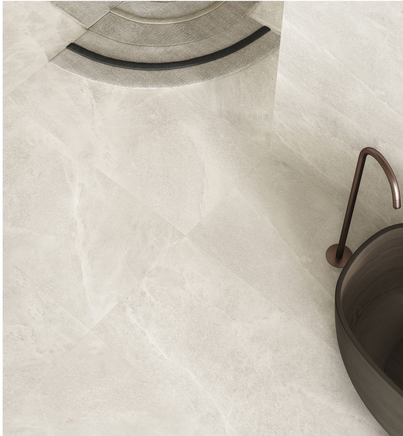
Salt Stone White Pure Lappato 90 × 180