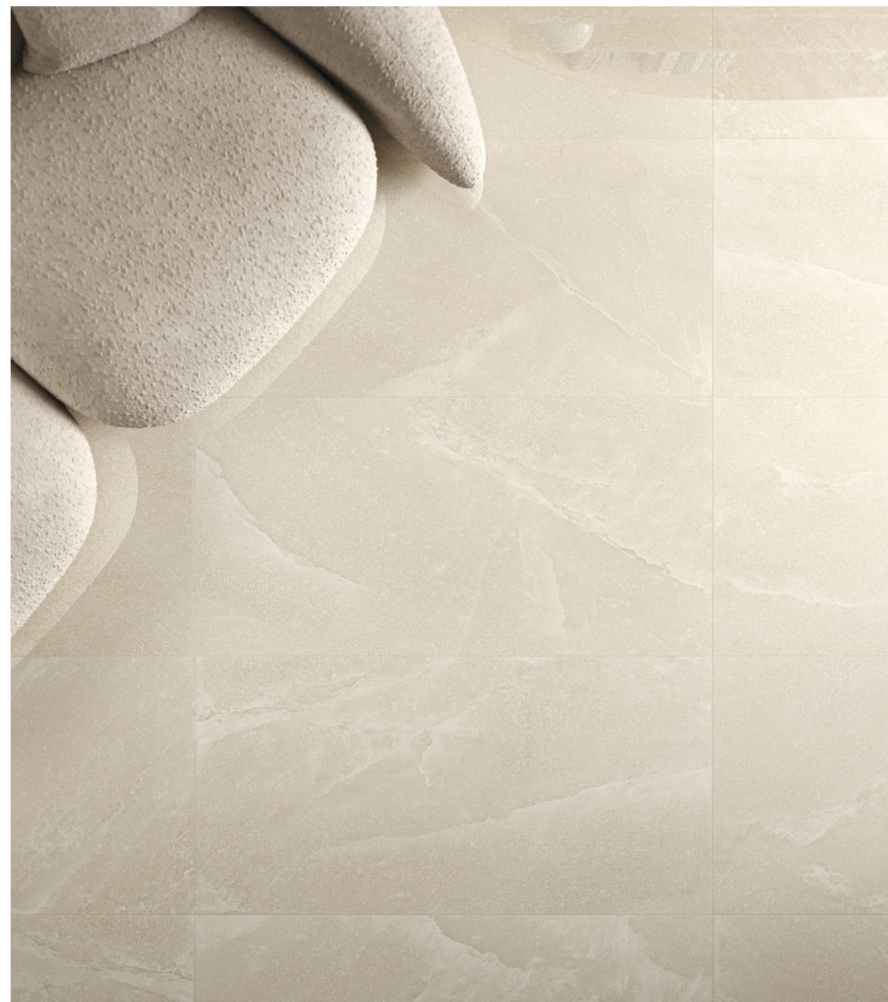
Salt Stone Sand Dust Lappato 90 × 180