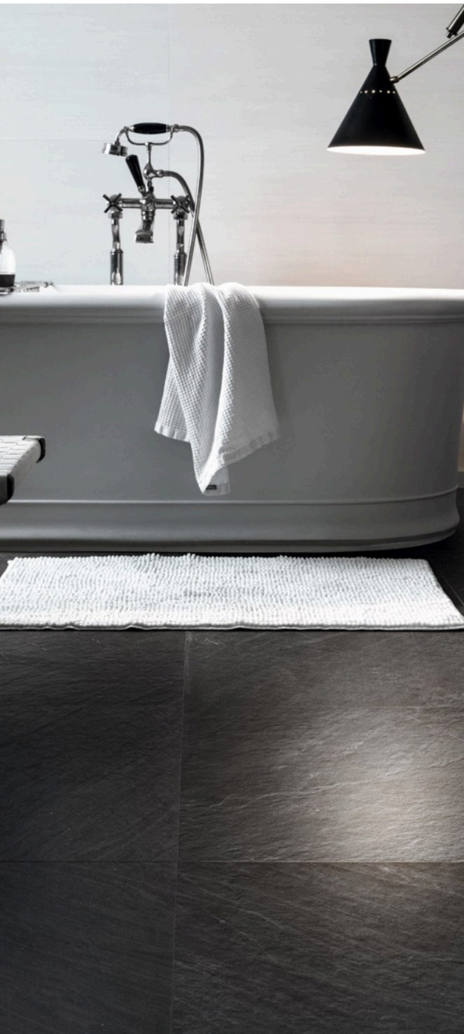
Lavagna Nero 75 × 150