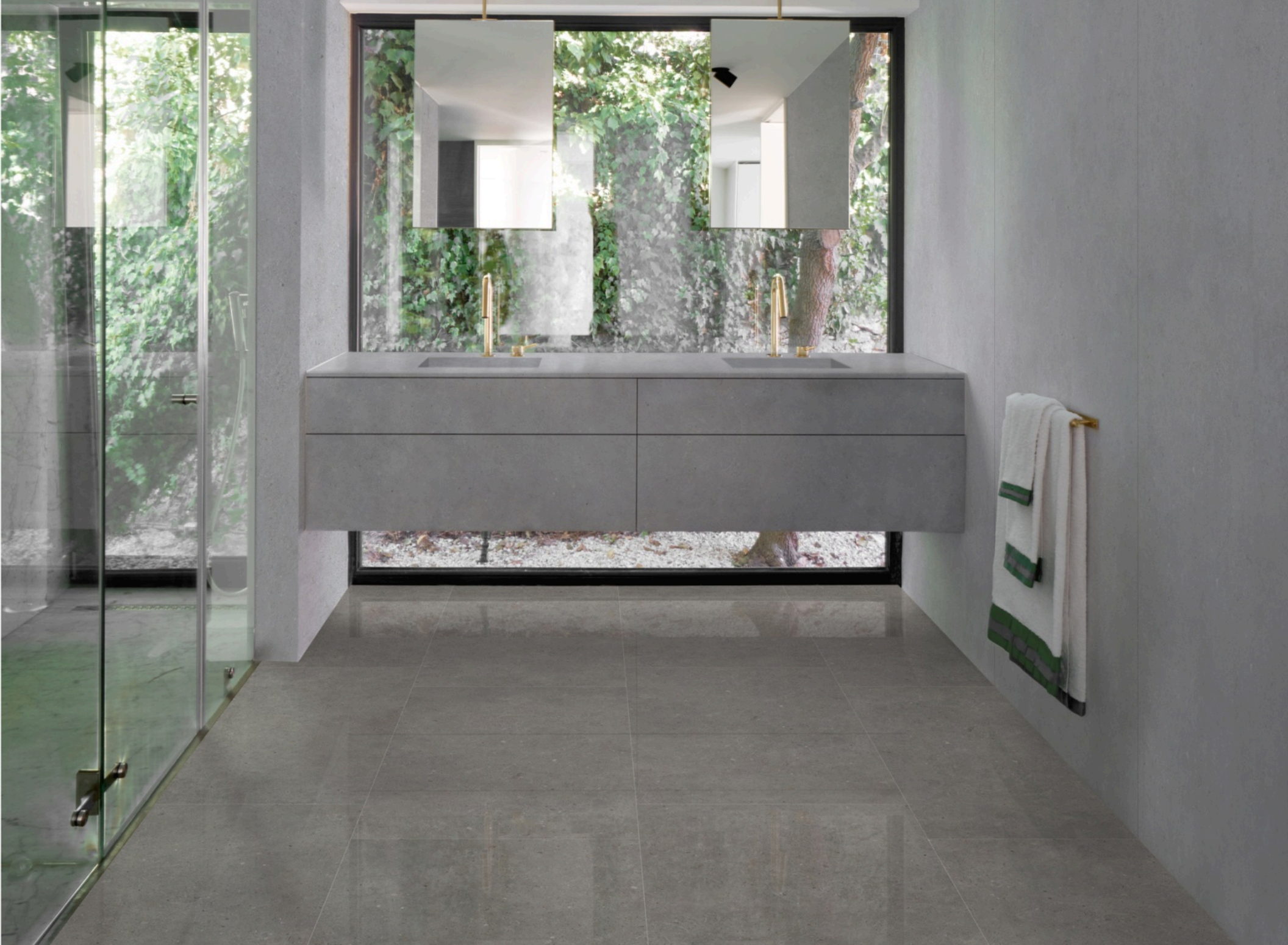
Brera Frame Glossy 120 × 120