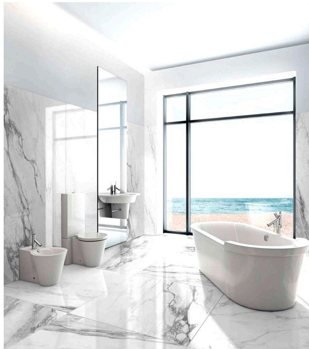
Bernini Glossy 120 × 120