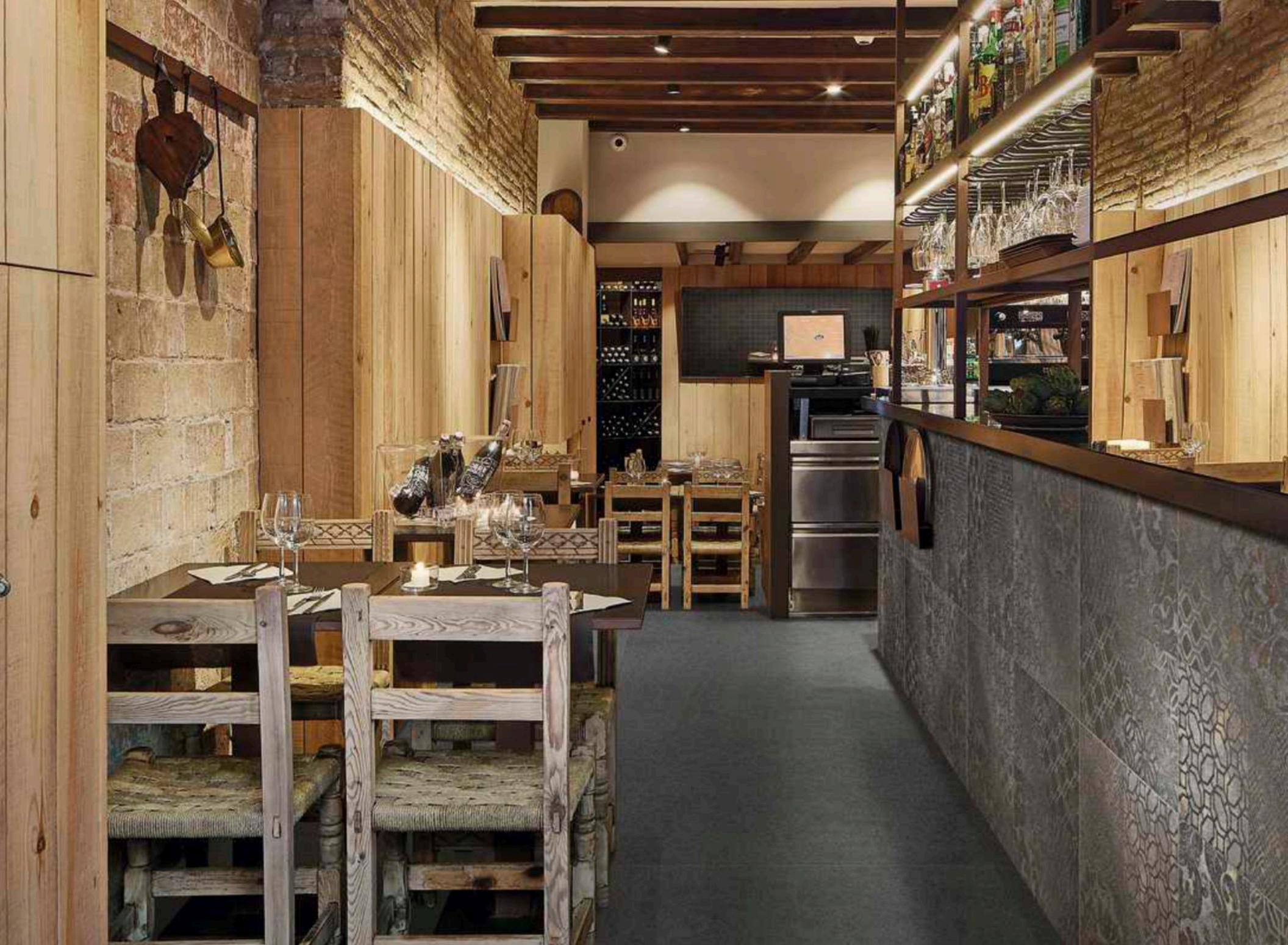
Basalto Lava 90 × 180