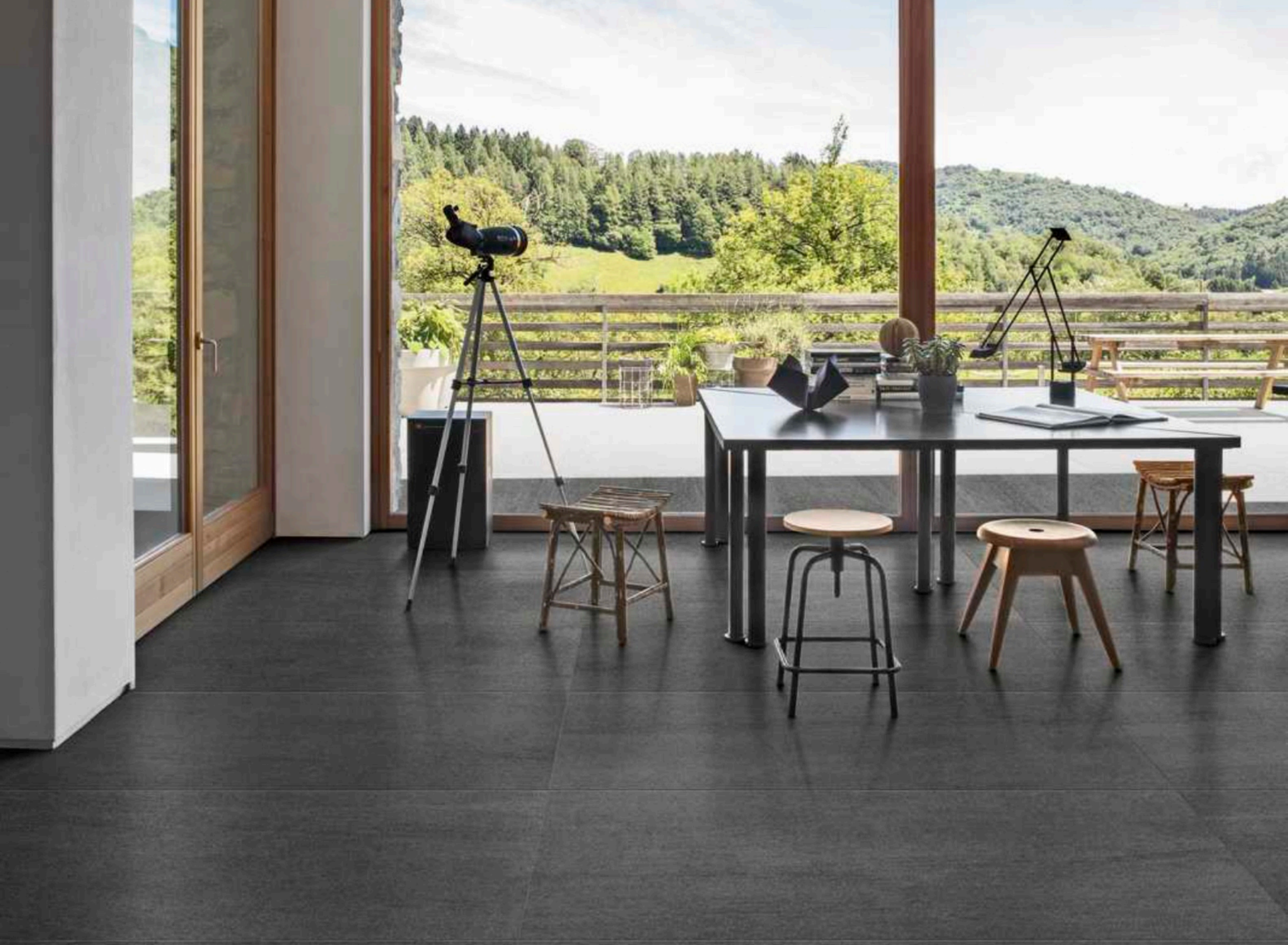
Basalto Lava 90 × 180