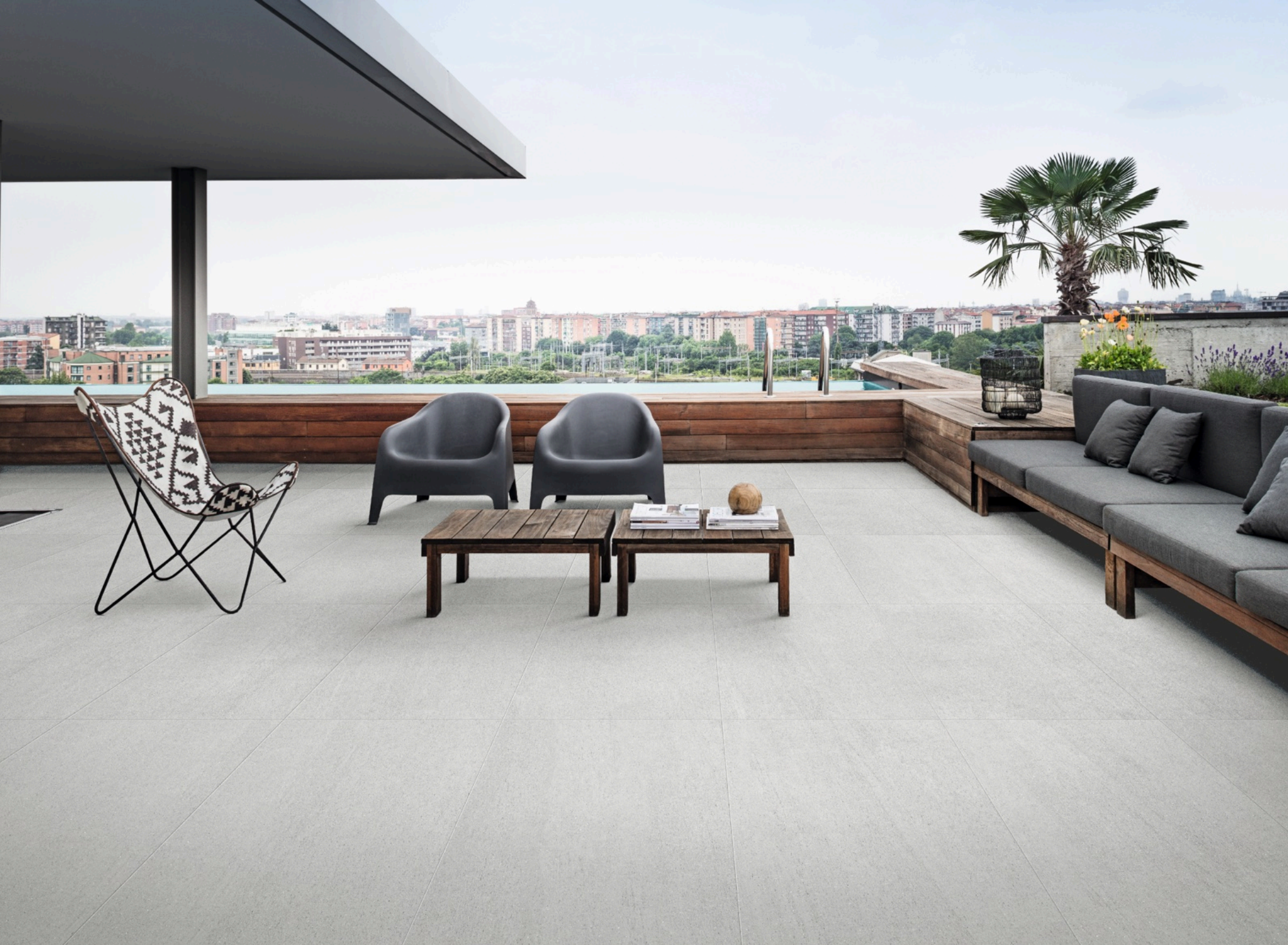
Basalto Pomice 90 × 180