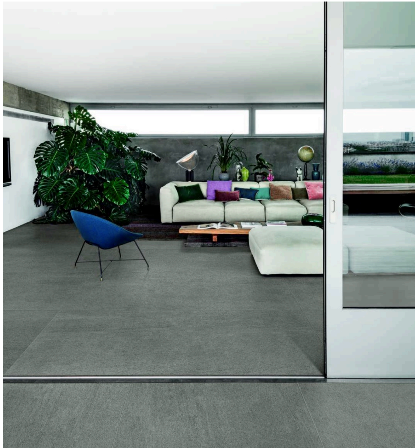
Basalto Piombo 90 × 180