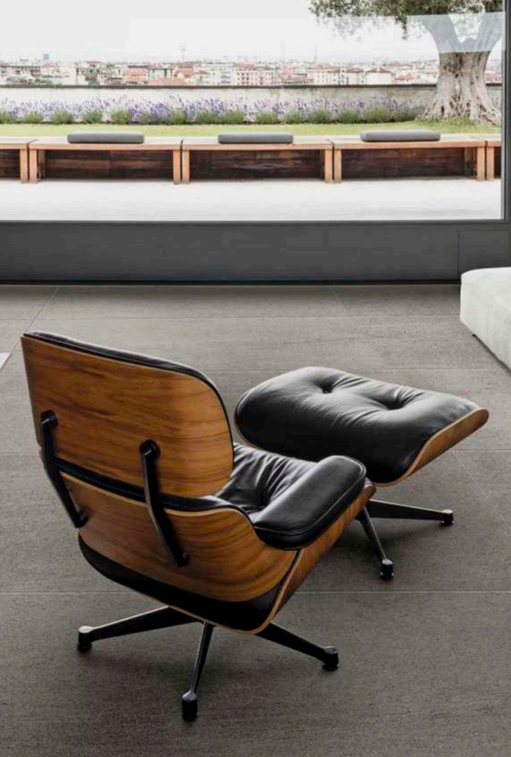
Basalto Sabbia 90 × 180