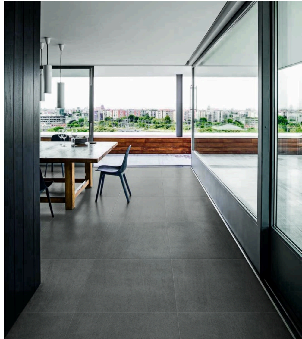
Basalto Piombo 90 × 180