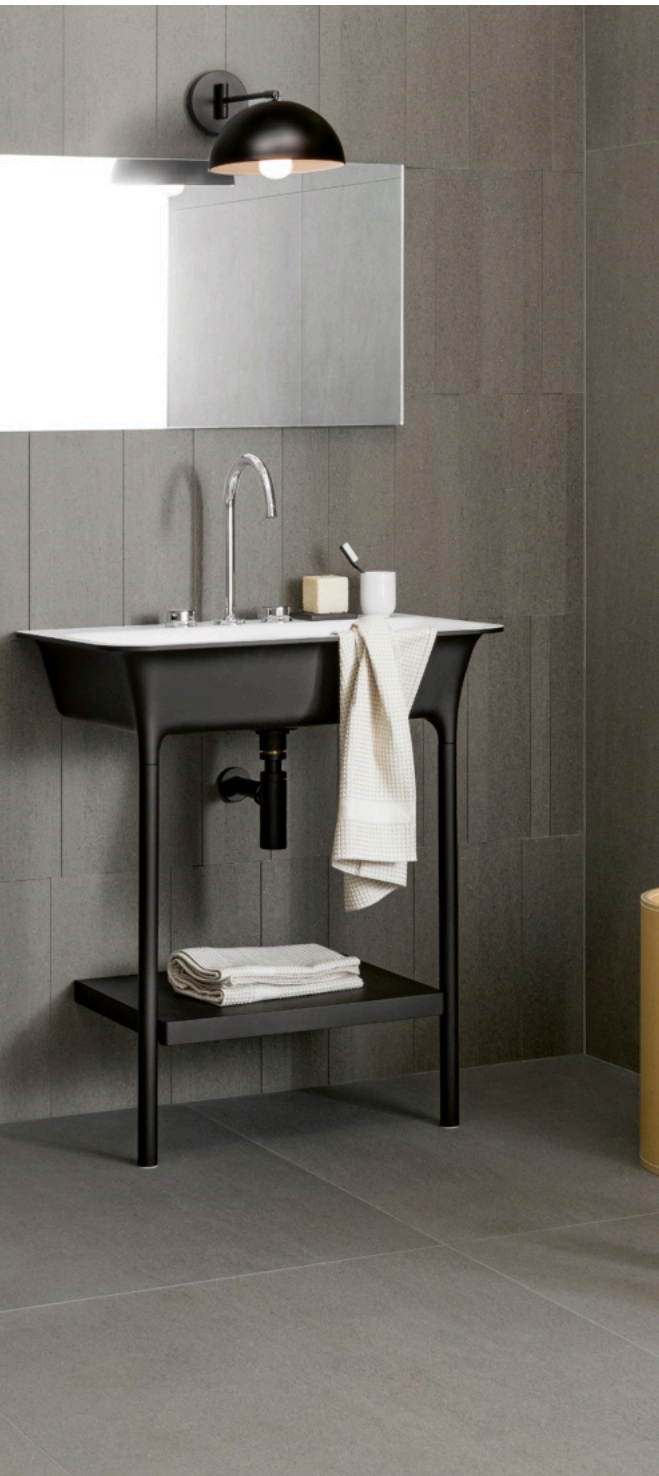
Basalto Sabbia 90 × 180