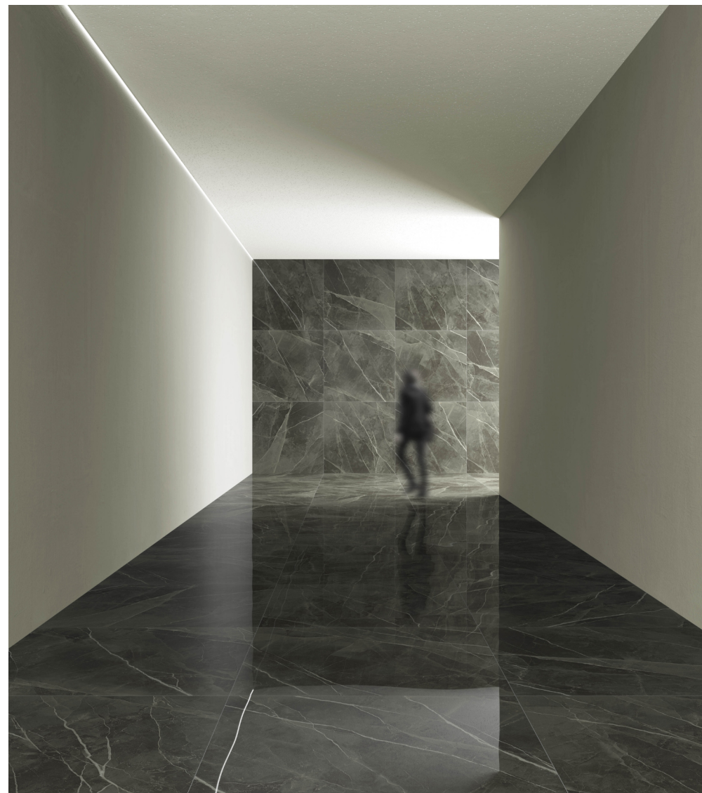
Archimarble2 Calacatta Black 120 × 120